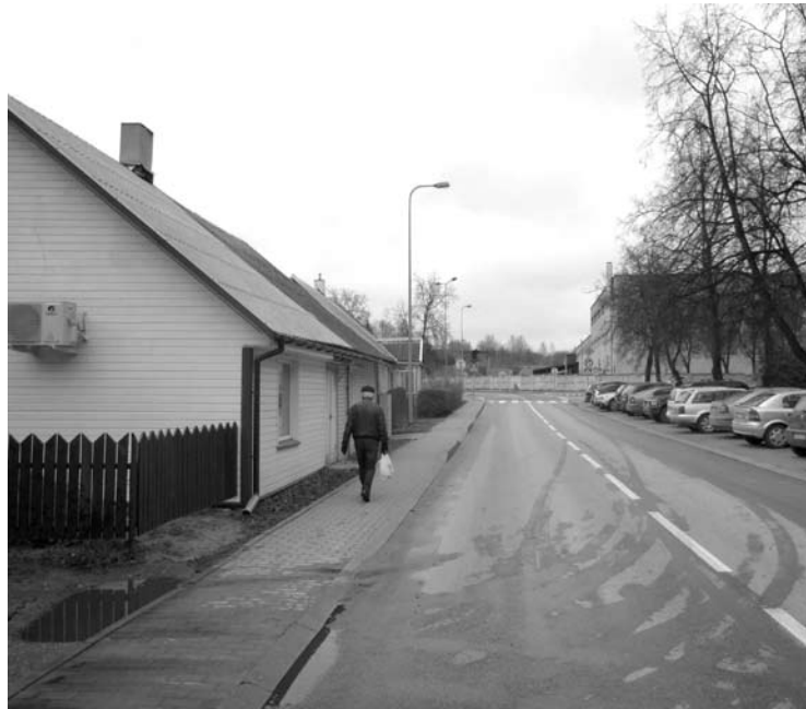
Ankstesnis nužudymas Anykščių K.Ladygos gatvėje sukrėtė anykštėnus.

2019-ųjų gruodžio 23-iają, Anykščiuose, name K.Ladygos gatvėje buvo rastas nužudytos 1928 m. gimimo senutės kūnas. Kitame to paties medinio namo gale gyveno metais jaunesnė aukos sesuo, kuri apie nelaimę sužinojo tik atvykus policijos pareigūnams. Įtariamieji močiutės žudikai - ne anykštėnai, vyras ir moteris, po kelių dienų buvo